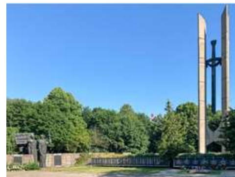
Монумент «Меч» советским воинам-освободителям в Клайпеде (Литва), 1975