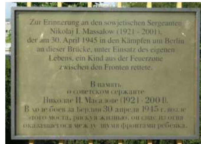
Мемориальная доска на одном из предполагаемых мест подвига Н.И. Масалова (Берлин-Тиргартен, Постдамер Брюке)