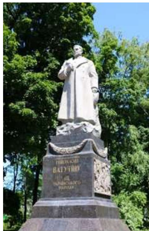
Памятник генералу Ватутину в Киеве, 1948