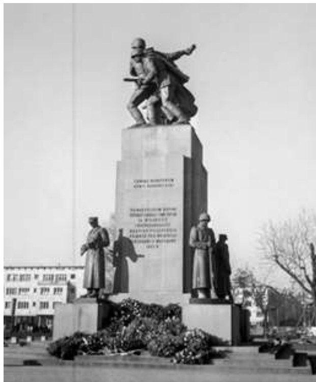
Памятник советско-польскому братству по оружию в Варшаве, 1945