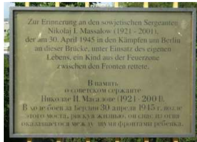
Мемориальная доска на одном из предполагаемых мест подвига Н.И. Масалова (Берлин-Тиргартен, Постдамер Брюке)