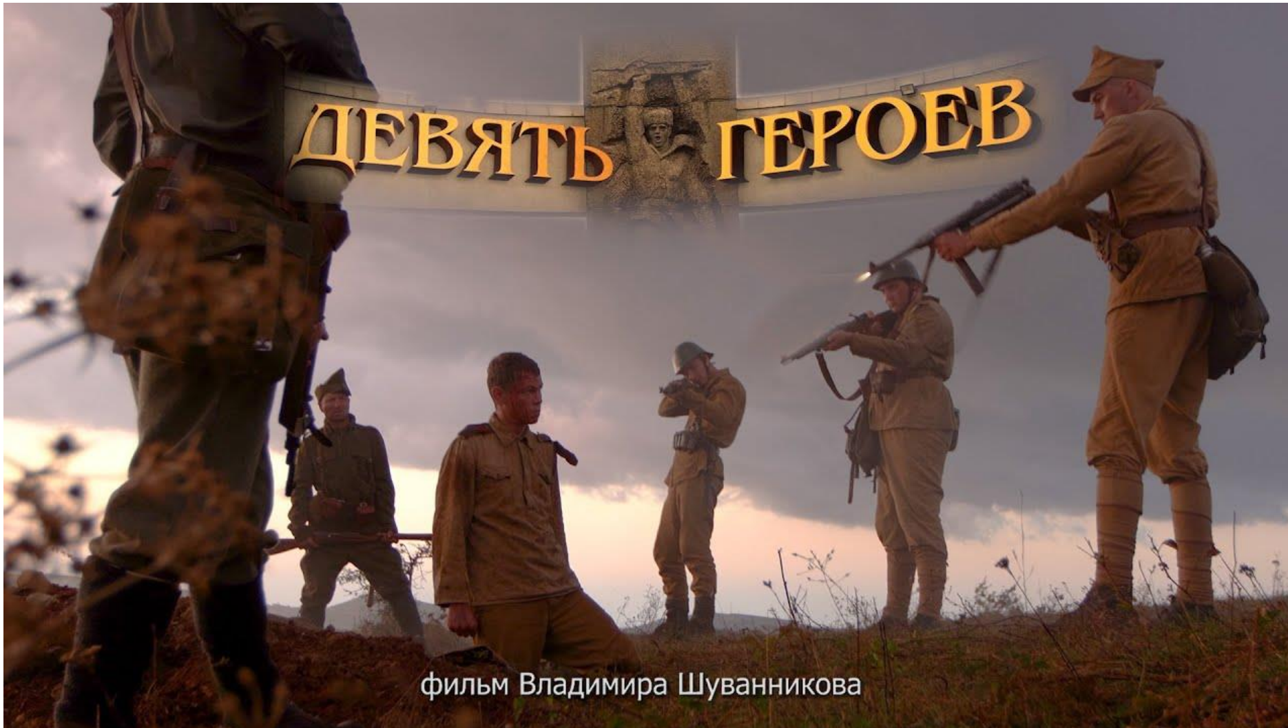
фильм Владимира Шуванникова