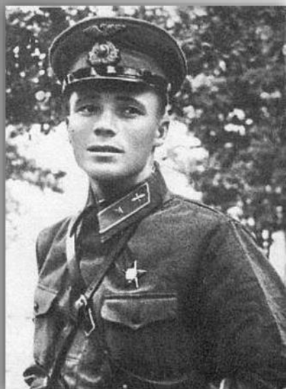
Летчик В. Талалихин