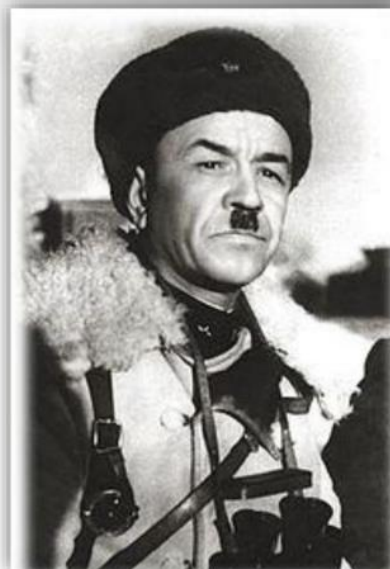
Генерал Панфилов И.В.