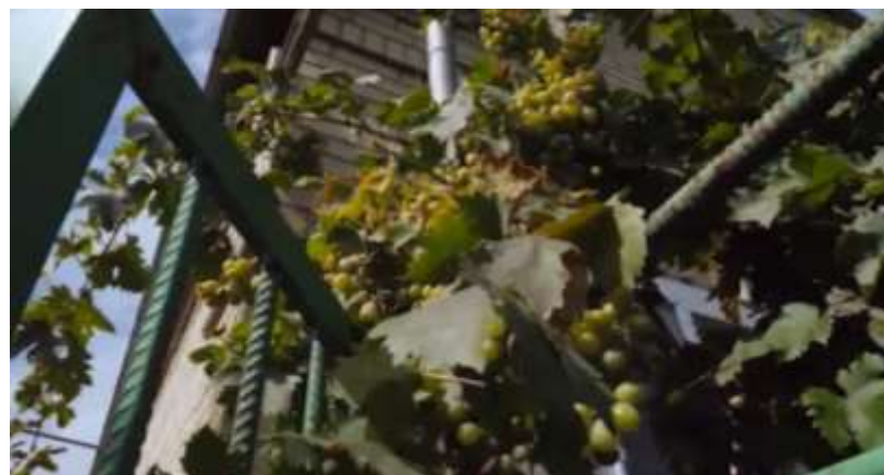
Природе не указ война. Черенок лопаты оставили, осенью - пророс