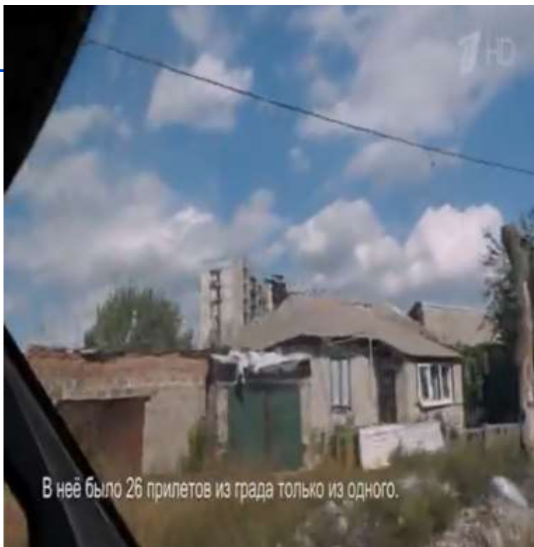
Девятиэтажка, выстоявшая под обстрелами