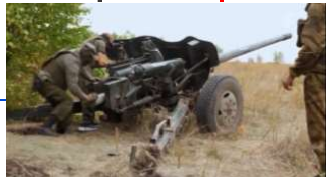
«Буханка» нужна...Газ... Помогай