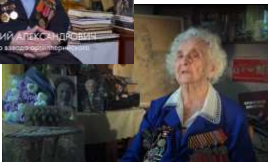
«Чтобы помнили», режиссер М. Комлев, 2018