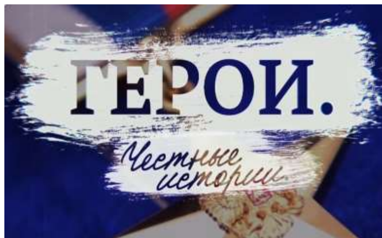
«Герои. Честные истории», режиссер Н. Зимина, 2018