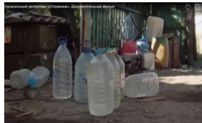
Нет питьевой воды нигде в колодцах