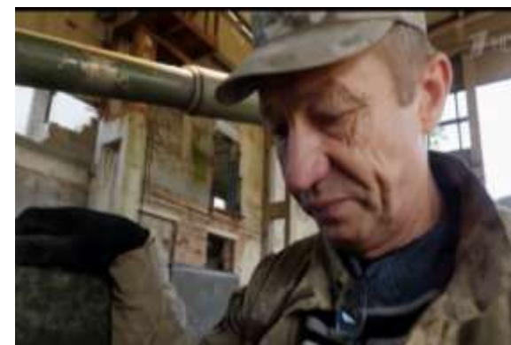
Встретил родных. Мне, как и моему дедушке, не нравятся фашисты