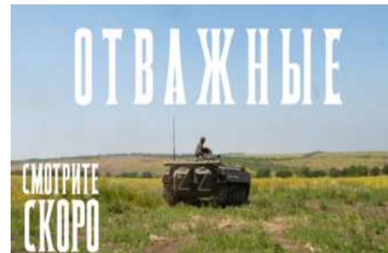
«Отважные», режиссер О. Шигина, 2023