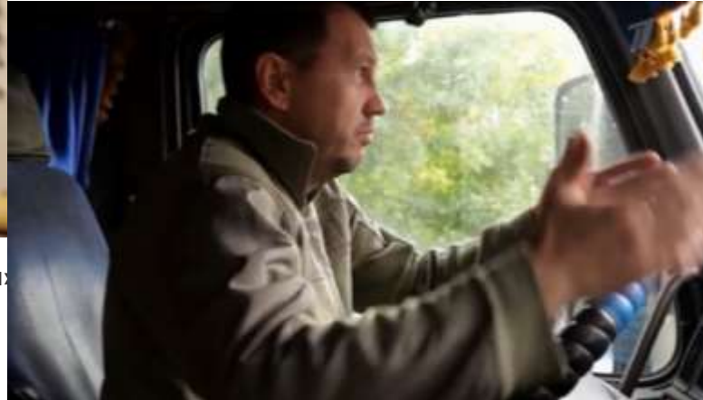
У меня есть бабушка и дедушка, а у них....