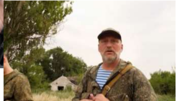
А защищать кто будет?