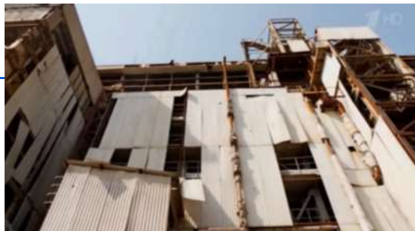
Завод. Шум не прекращается ни на минуту