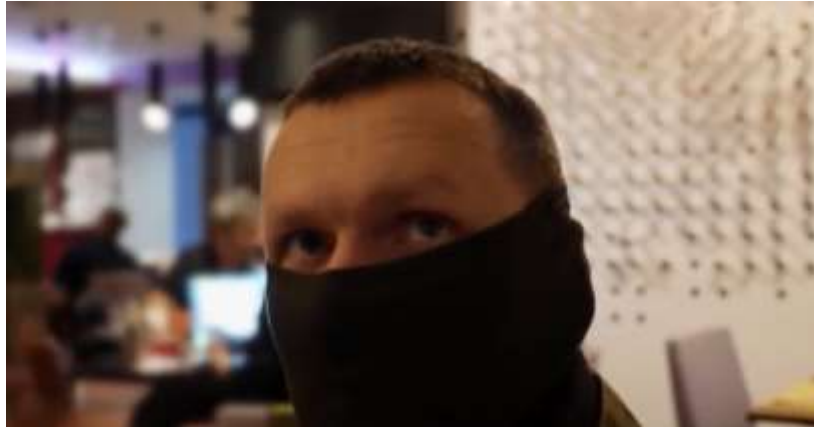
Будем разбираться после войны. Без «доброжелателей»

Понимаю украинский... Горячая фаза... ничего не прекращалось... Подружиться-то сможем? Мы и не ссорились с людьми