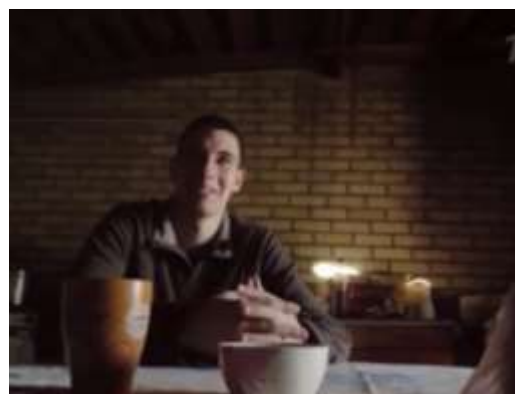
Ко всему привыкаешь...Грады Постираться же надо...