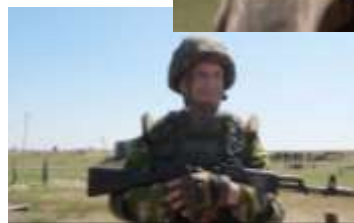
Бесстрашные... Знаешь что такое ад?