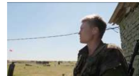
Ответственность за других