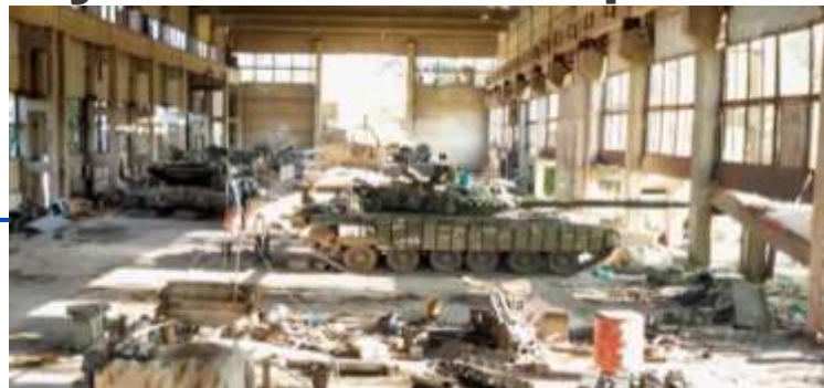
Танк...За день 7 выездов... Артиллерия так и не смогла поймать ... 250 000 долларов