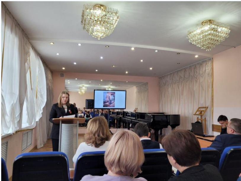
НПК «Традиции семьи и их значение в воспитании»