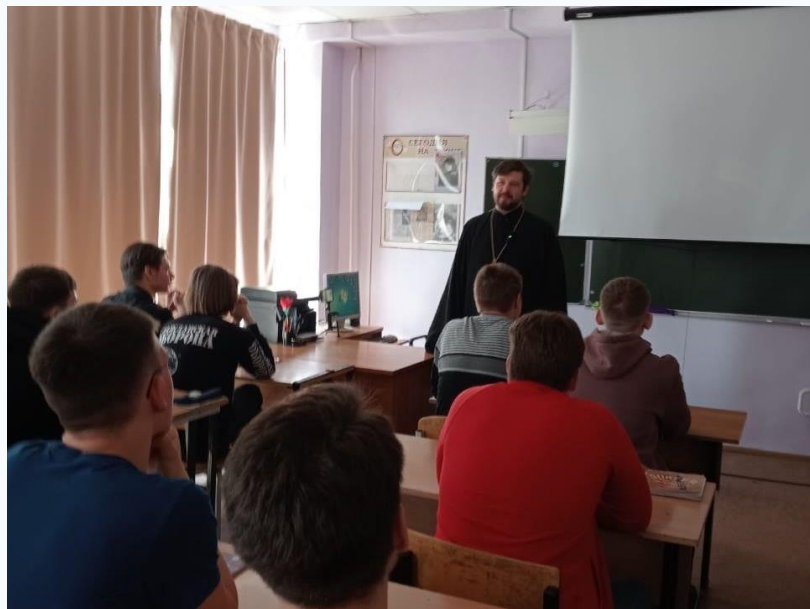
Воркшоп «Семейные ценности»