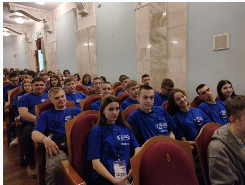
НПК «Профессиональное образование и занятость молодежи: XXI век. Год педагога и наставника: сохраняя прошлое, создаем будущее»