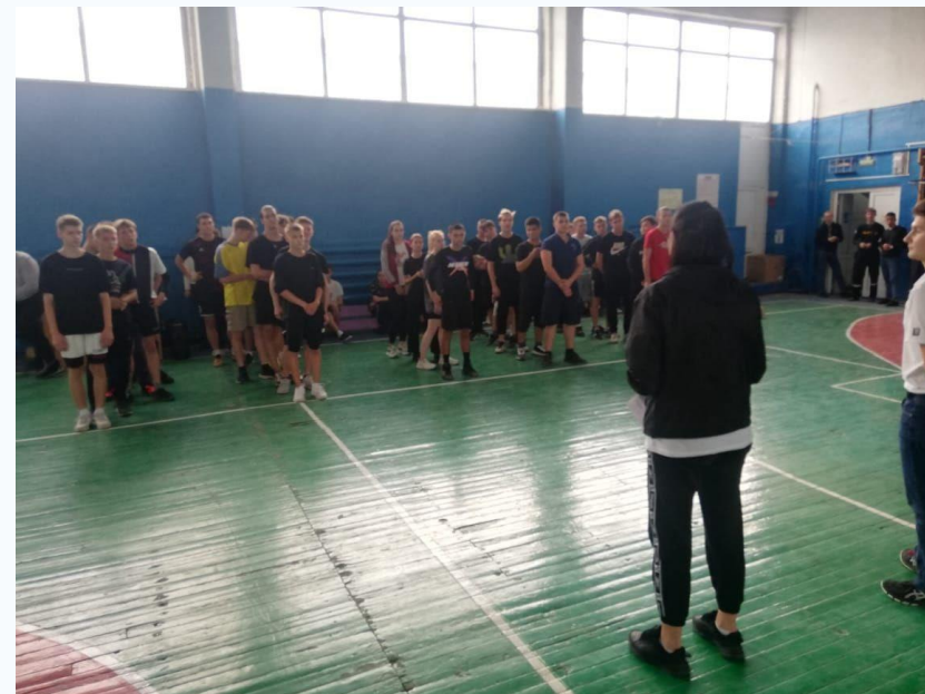
Спартакиада «Спорт, здоровье, семья»