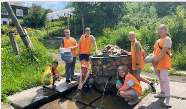
Акция «Живи, родник!»