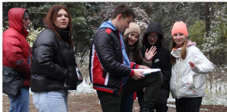
Экологический квест в Рудничном бору