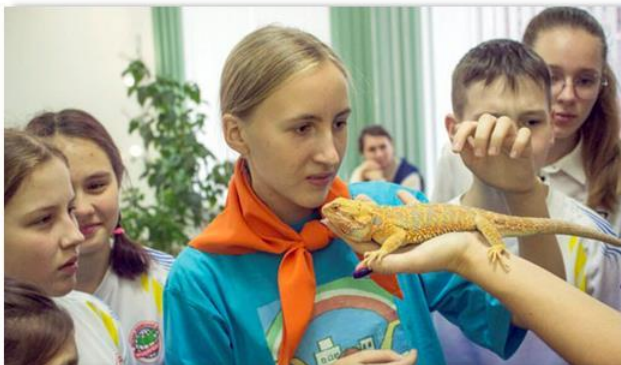
Конкурс «Разговоры у костра»