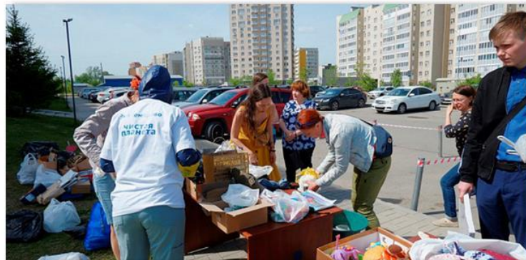
Акция «Соберем. Сдадим. Переработаем»