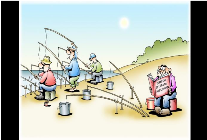
Задание для команды №1