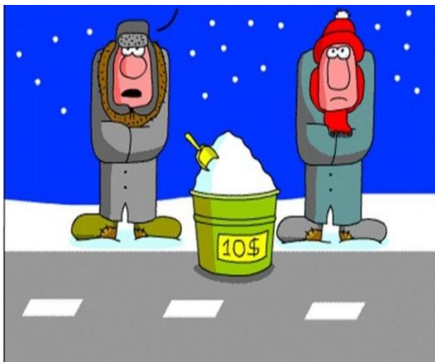
Задание для команды №3