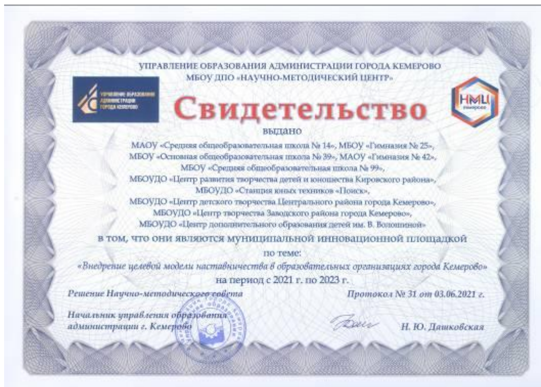
Рис. 3. Свидетельство, подтверждающее деятельность муниципального сетевого инновационного проекта «Внедрение целевой модели наставничества в образовательных организациях города Кемерово» на базе МБОУ ДО «Центр дополнительного образования детей им. В. Волошиной»

Помимо открытия инновационных площадок на базе Центра, анализ потребностей, затруднений педагогов в ходе исследований продвижения образовательных услуг Центра позволил методистам организовывать педагогов на прохождение курсов повышения квалификации. Повышение квалификации связано с необходимостью обновления знаний, навыков руководящих и педагогических работников в связи с повышением требований к их уровню квалификации, освоению ими новых способов решения профессиональных задач.