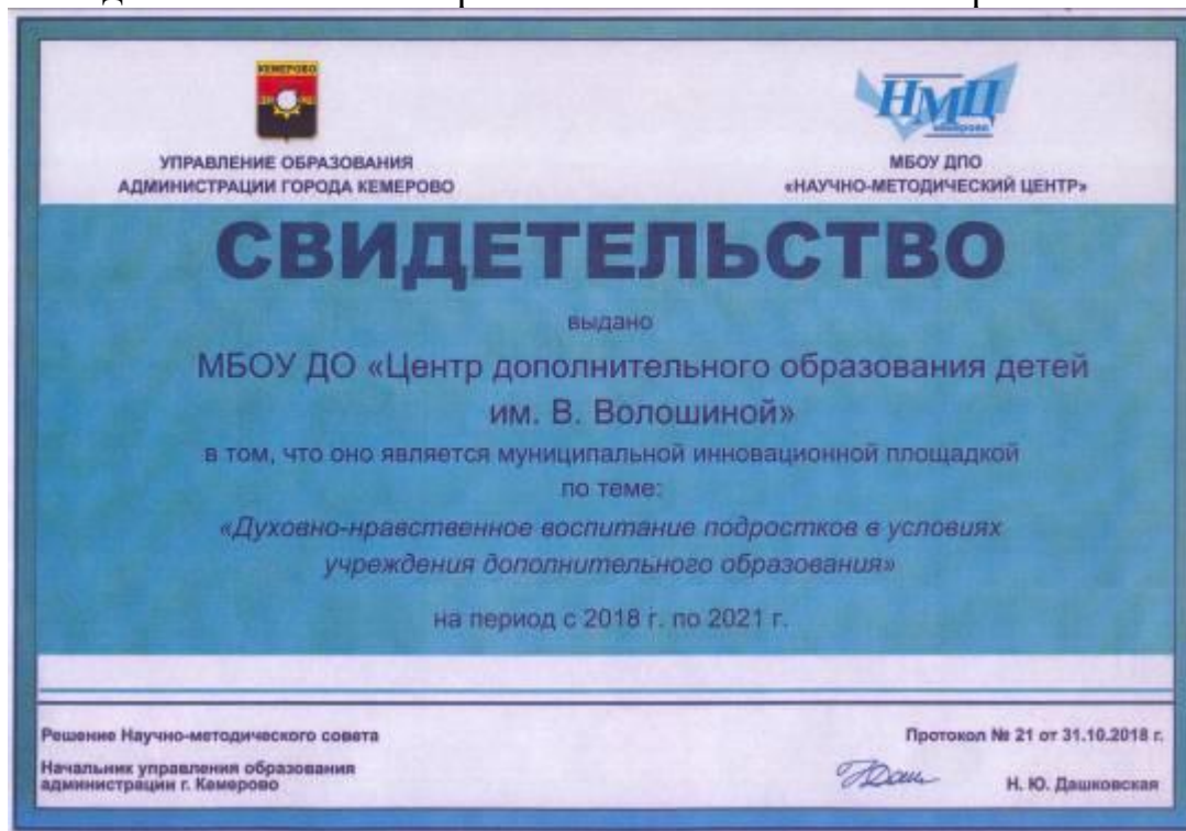
Рис. 2. Свидетельство, подтверждающее деятельность муниципальной инновационной площадки на базе МБОУ ДО «Центр дополнительного образования детей им. В. Волошиной»

методистами подготовлены соответствующие документы и учреждение стало муниципальной инновационной площадкой по теме «Духовно-нравственное воспитание подростков в условиях учреждения дополнительного образования», протокол № 21 от 31.10.2018 Научно-методического совета МБОУ ДПО «Научно-методический центр», г. Кемерово. Результат работы инновационной площадки – публикация методического пособия для педагогов дополнительного образования по обозначенной проблеме.