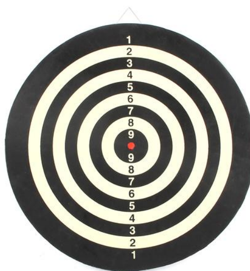
Рисунок 1 – Мишень для дартса