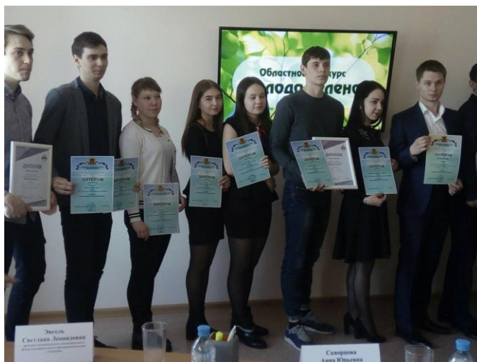
Победители конкурса «Молодо-зелено»