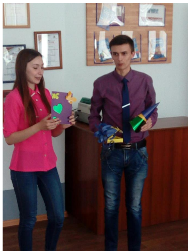
Конкурс профессионального мастерства по компетенции «Предпринимательство»