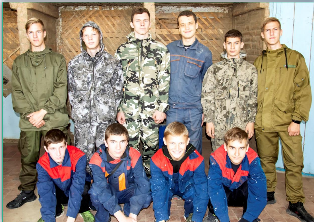
Волонтеры из группы Штукатур

Цель группы волонтерского движения: развитие добровольческого движения в нашем техникуме через оказание помощи в ремонтных работах ветеранам техникума.